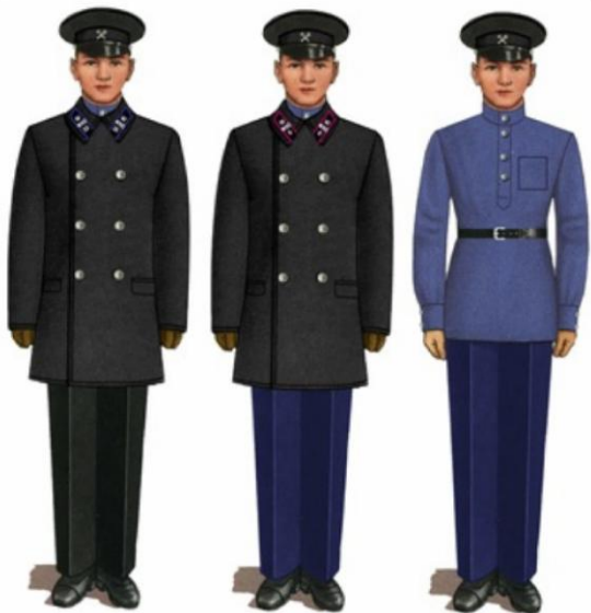
Учащийся школы ФЗО в зимней форме одежды